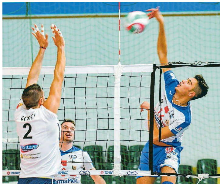
Un'immagine della gara giocata dal Gabbiano contro Scanzorosciate